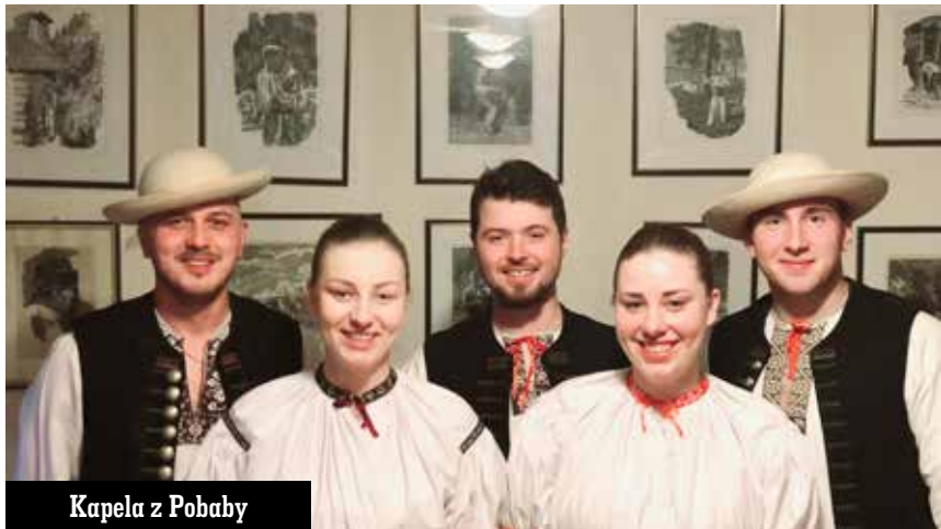
Kapela z Pobaby