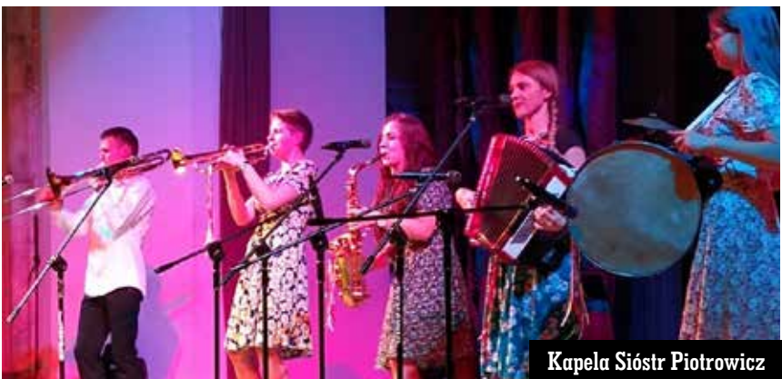
Kapela Sióstr Piotrowicz