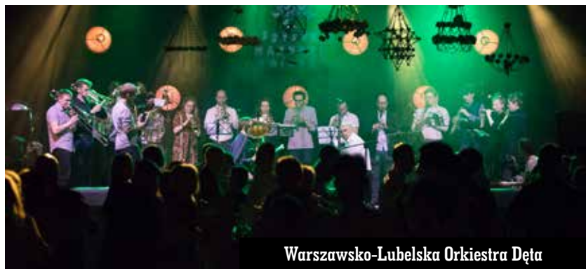
Warszawsko-Lubelska Orkiestra Dęta